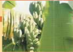
Buah pisang siap panen

Informasi lebih lanjut: Pusat Pengembangan dan Pelebaran Teknologi Pertanian Jalan B. H. Juanda No. 20, Bogor 16122 Telepon (0251) 321746, Faksimil (0251) 326561 E-mail: p2pip@bptp.pertanian.go.id, atau web: http://www.p2pip.pertanian.go.id