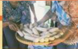
Buah pisang yang telah dikukus