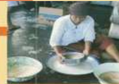
Pensaringan tepung pisang

P isang dapat dikonsumsi dalam bentuk segar atau olahan, seperti pisang rebus, pisang goreng, serta berbagai jenis kue atau makanan ringan. Pengolahan pisang dilakukan dengan berbagai alasan, antara lain untuk memperkaya rasa dan aroma, memperpanjang waktu simpan, serta meningkatkan nilai tambah.